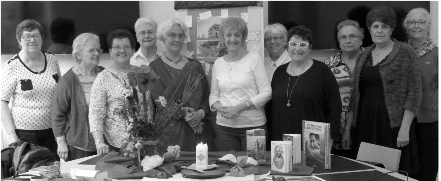
Le Comité JMP-France en mars 2016

La présidente est entourée d'un comité de 10 membres.